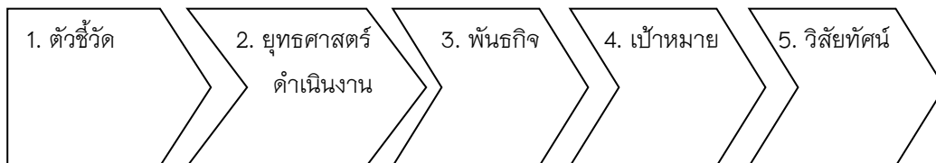
ภาพ 3 ยุทธศาสตร์การบริหารจัดการด้านเทคโนโลยีเพื่อส่งเสริมการนั้งสมาธิของวัดพระธรรมกายตามปรัชญาของเศรษฐกิจพอเพียงที่จัดแบ่งเป็น 5 ด้าน