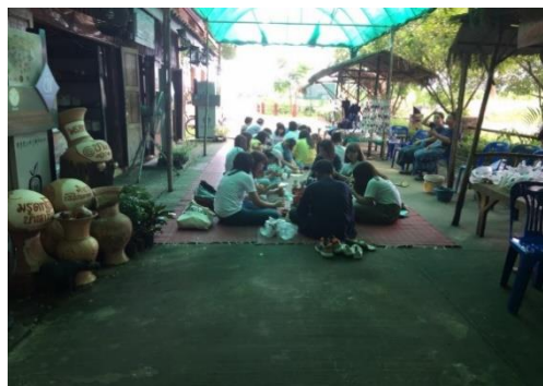
ภาพที่ 4 ภาพจากการเก็บข้อมูล - แสดงกิจกรรมของนักท่องเที่ยวชาวญี่ปุ่นมาเรียนรู้การเขียนลวดลายบนเครื่องปั้นดินเผา