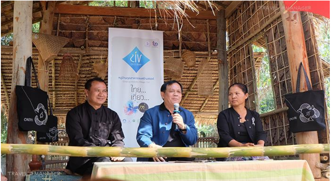
ภาพที่ 2 ภาพแสดงการแถลงข่าวเปิดตัวหมู่บ้านอุตสาหกรรมสร้างสรรค์ CIV ( ที่มา : www.thaiciv.com )

ยกระดับขีดความสามารถเพื่อให้ผู้ประกอบการปรับตัวให้ทันต่อสถานการณ์เศรษฐกิจโลก ( ที่มา : www.thaiciv.com สืบค้นวันที่ 1 มิถุนายน 2560 )