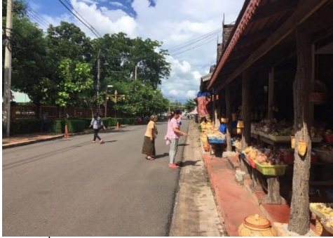
ภาพที่ 5 ภาพจากการเก็บข้อมูล - แสดงการจัดการทางกายภาพที่พบปัญหาหนักที่ท้องเที่ยวต้องเดินบนทางถนน