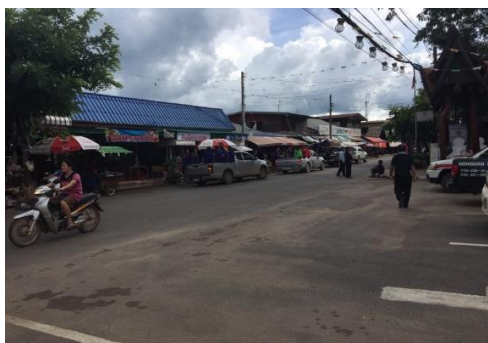
ภาพที่ 3 ภาพจากการเก็บข้อมูล - แสดงการจัดการทางกายภาพที่พบปัญหาด้านพื้นที่จอดรถ และนักท่องเที่ยวต้องเดินบนทางถนน